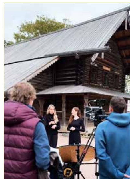
В Великом Новгороде идут съёмки сразу двух видеогидов на русском жестовом языке.