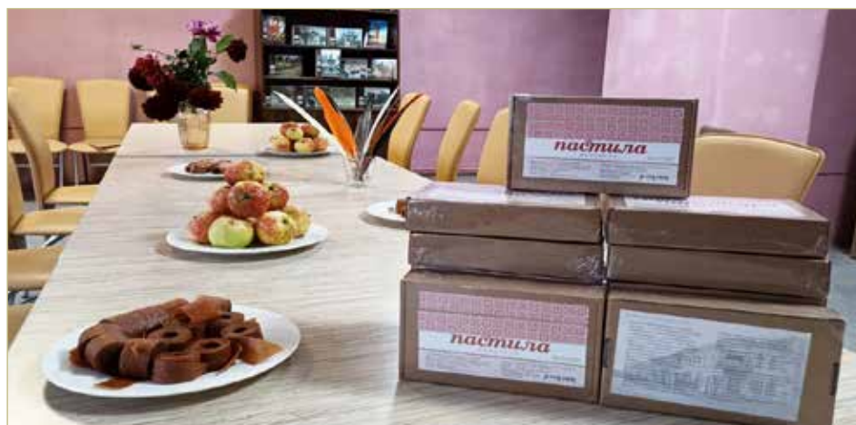
В Медведь туристов манит пастила.