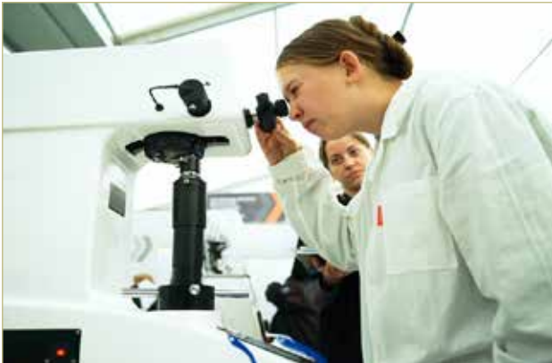
Чемпионат высоких технологий собрал в Великом Новгороде представителей 26 стран мира и 76 регионов России.