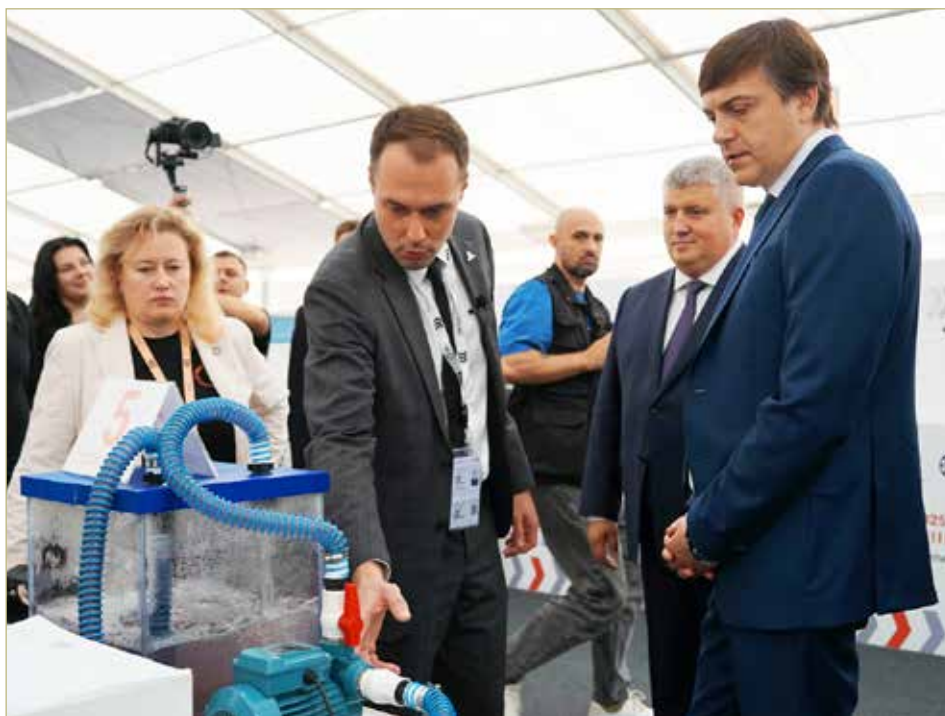
Министр просвещения РФ Сергей Кравцов отметил высокий уровень проведения Чемпионата высоких технологий.

— Древний Новгород на несколько дней стал центром современных технологий, профессионального образования и самой талантливой молодёжи, — сказал глава региона. — Вы показали всё, что умеете, к чему стремитесь. Наш президент поставил задачу — достичь технологического суверенитета, и сегодня,