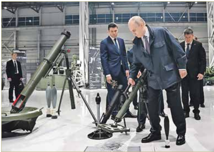
Владимир Путин оценил то, насколько бойцу на СВО легко будет подхватить новый миномет и сменить свою позицию.

— То, что случилось за время СВО с нашей обороной, — это подвиг, — сказал он. — В 2018-м наш завод тонул в долгах. А в 2022-м к нам приехали зам-