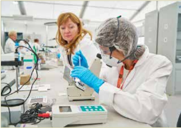
Финалисты соревновались в 15 новейших компетенциях, которые совсем скоро станут новыми востребованными профессиями.