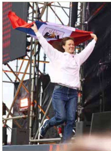
Церемонию награждения победителей финала ЧВТ организаторы превратили в большой праздник.